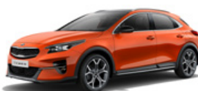
Orange Fusion (metalický lak)