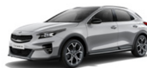
Sparkling Silver (metalický lak)