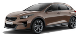
Cooper Stone (metalický lak)