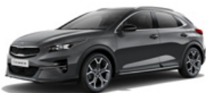
Penta Metal (metalický lak)