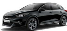
Black Pearl (metalický lak)