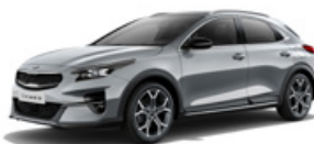
Lunar Silver (metalický lak)