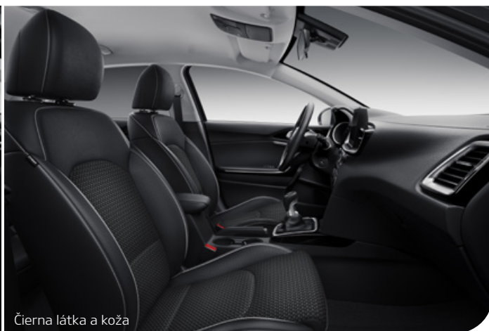
Čierna látka a koža