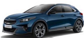
Cosmos Blue (metalický lak)