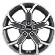
18-palcové disky kolies z ľahkých zliatin