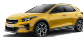
Quantum Yellow (metalický lak)