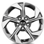
16-palcové disky kolies z ľahkých zliatin