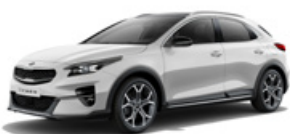
Deluxe White (metalický lak)