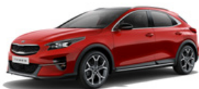
Infra Red (metalický lak)