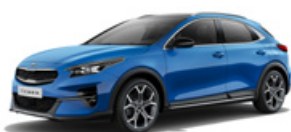
Blue Flame (metalický lak)