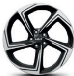
21-palcové disky kolies z ľahkých zliatin (pneumatiky 255/40 R21)